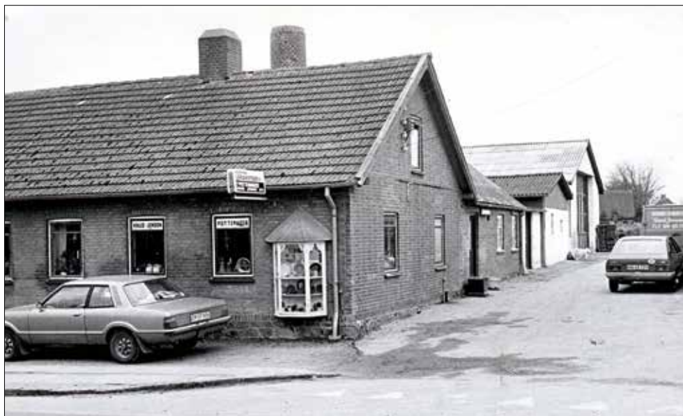
Hovedgaden 8 i Sorring fotograferet i 1976.

Om sommeren arrangerede musikere og restauratører store teltballer, blandt andet i