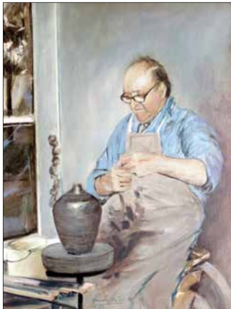
Maleri af Henning Busk 1990. (Privateje).

Ubemærket af de toneangivende medier lever spillemandsmusikken i Østjylland vi-