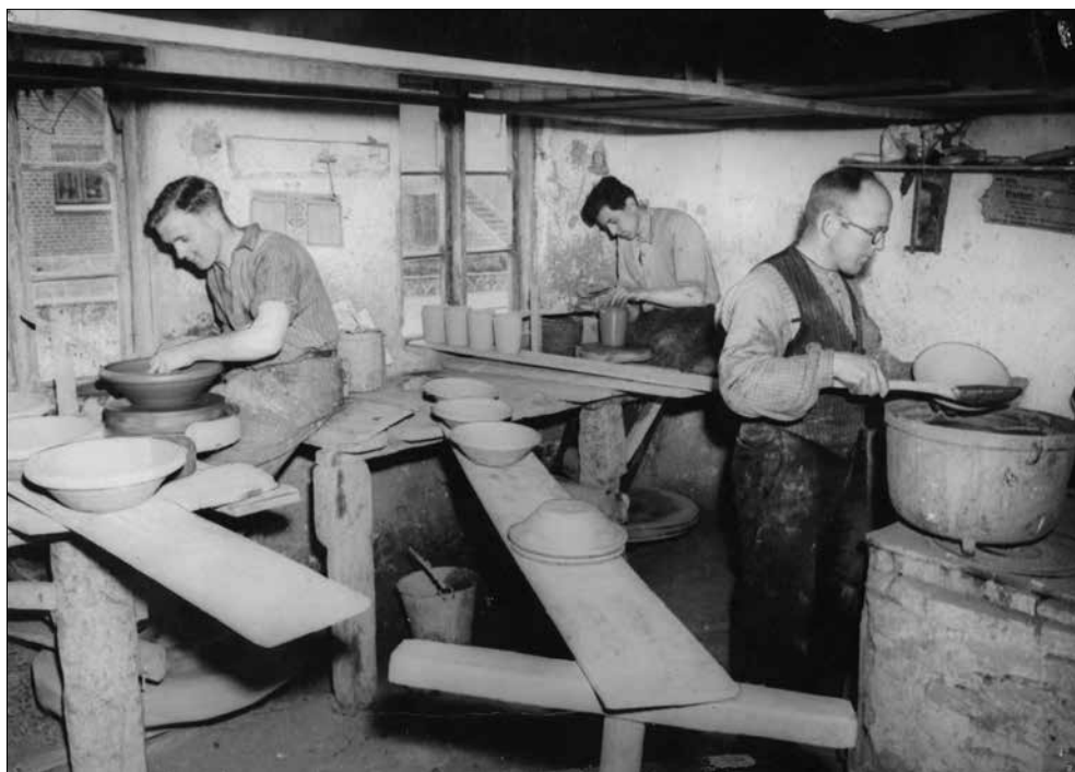
Alt imens pottemageren udviklede sin virksomhed i industriel retning, fortsatte håndværket. Her i 1950 to medarbejdere, der drejer, mens mester selv begitter, det vil sige hælder en flydende lermasse på.

Sorring-traditionen, hvor man med fingrene tryller smukt husgeråd op af en klump rød- eller blåler, overlevede dermed på næsten mirakuløs vis side om side med nye tider. Virksomheden - nu Sorring Lervarefabrik - stod efterhånden solidt på to ben: håndværk og industri.