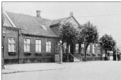
Mundelstrup Kro, som den så ud i 1920. Her blev den unge pottemager optaget i (bal)musikernes jagforening.