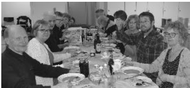
Guleærter og en snaps efter generalforsamlingen

Det kalkulerede overskud kunne medlemmerne leve med - og budgettet blev godkendt.